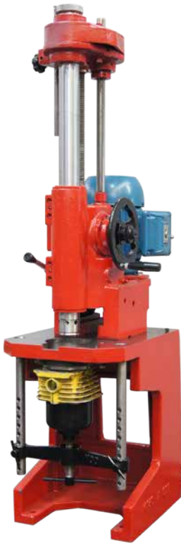
Modelo: BVC-90E BVC-65