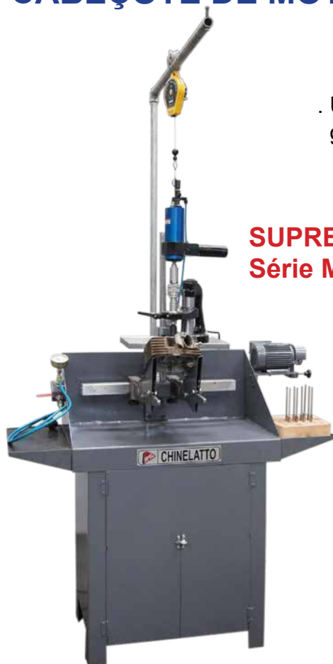
SUPREMA Série M-A

. Útil p/ remoção e usinagem da sede em grau c/ uso de ferramenta.