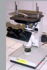
Microscópio para análise metalográfica