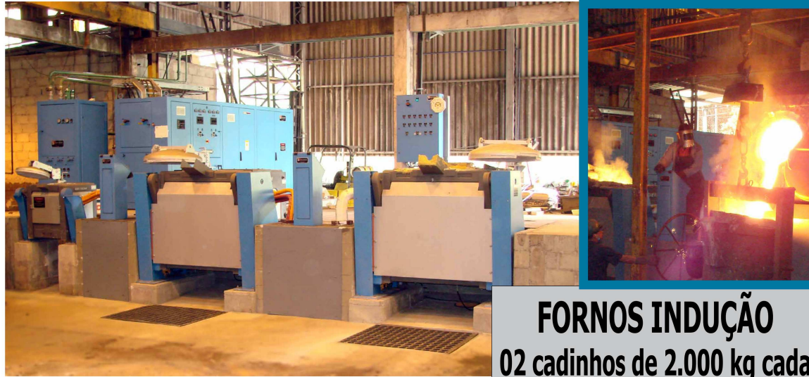
FORNOS INDUÇÃO 02 cadinhos de 2.000 kg cada