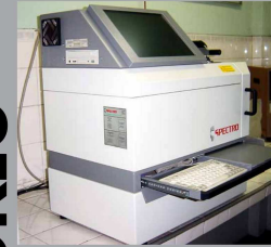
Espectômetro Óptico para análise química